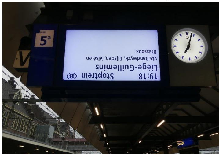
Afb. 3 In 2021 stond de wereld op z'n kop hetgeen geïllustreerd wordt door een foto in het station van Maastricht op 10 juli 2021

Het bestuur van de SNR spreekt ook dit jaar met groot genoeg woorden van dank uit aan de vele vrijwilligers die er voor zorg(d)en dat onze collectie groeit, wordt geordend en steeds toegankelijker wordt voor leden en niet-leden.