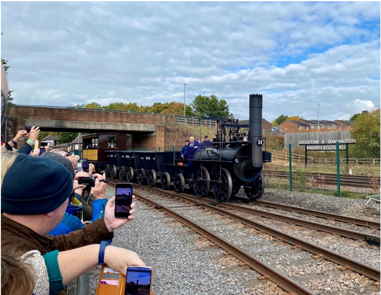
2025-09-25 Stockton & Darlington Re-enactment 200 jaar spoorwegen.

Stoomlocomotieven net even anders bekeken...