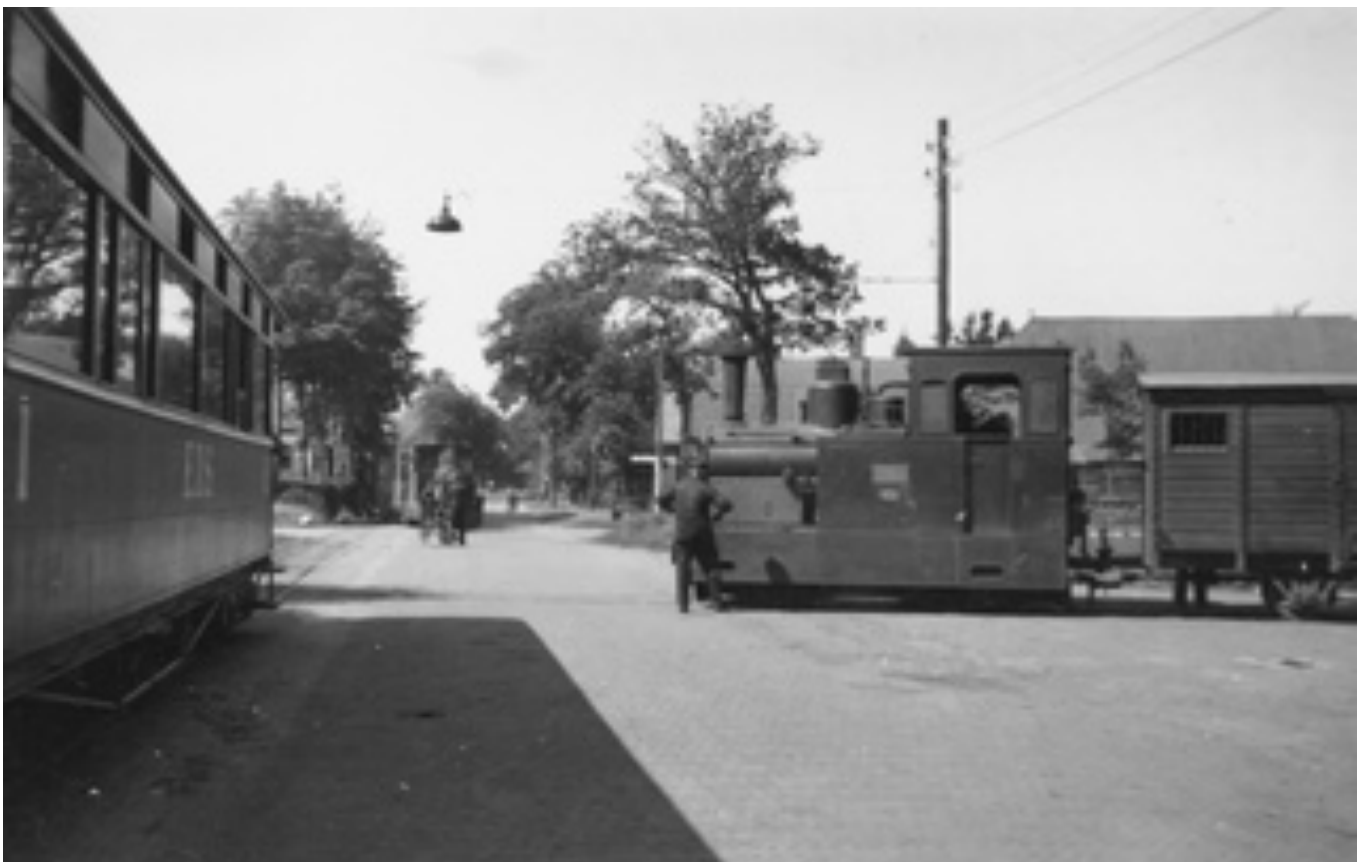
Foto: Oosterhesselen, EDS 17, 1924/Hohenzollern), tramkruispunt met drie trams, 1941.