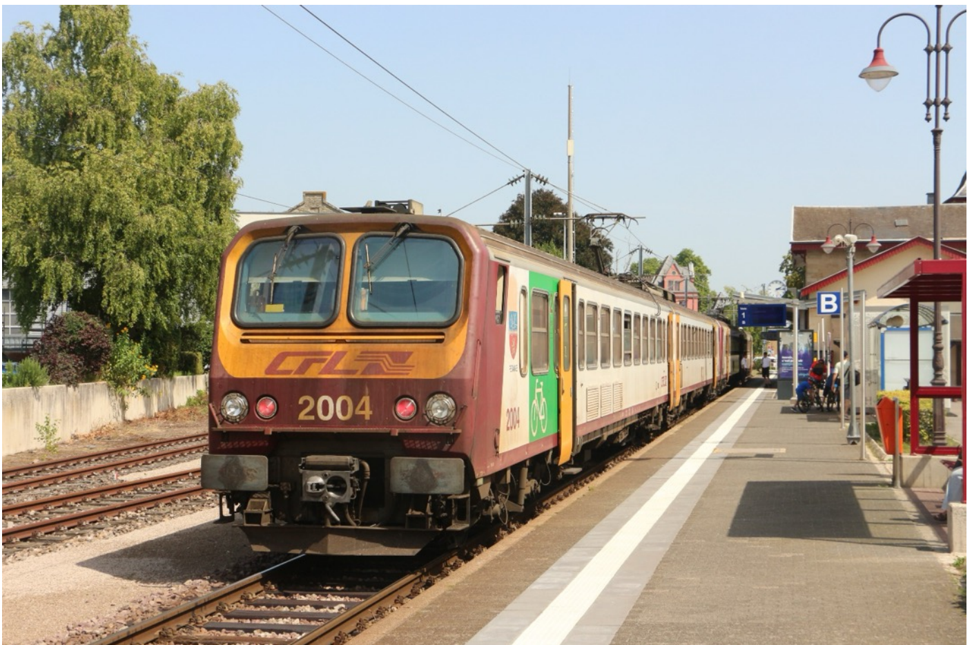
Foto: De 2004 is hier samen met de 2008 in Diekirch te zien op 13 augustus 2025. In november zouden de stellen definitief buiten dienst gaan. Ze zijn naar Roemenië verkocht.

Het Groothertogdom Luxemburg ligt heel dichtbij, maar is bij velen toch onbekend. De spreker neemt u vanavond mee naar Luxemburg en toont u beelden waarbij het zwaartepunt ligt in de periode 1993 tot en met 2012, maar we zullen ook een kleine update tonen tot aan 2026.