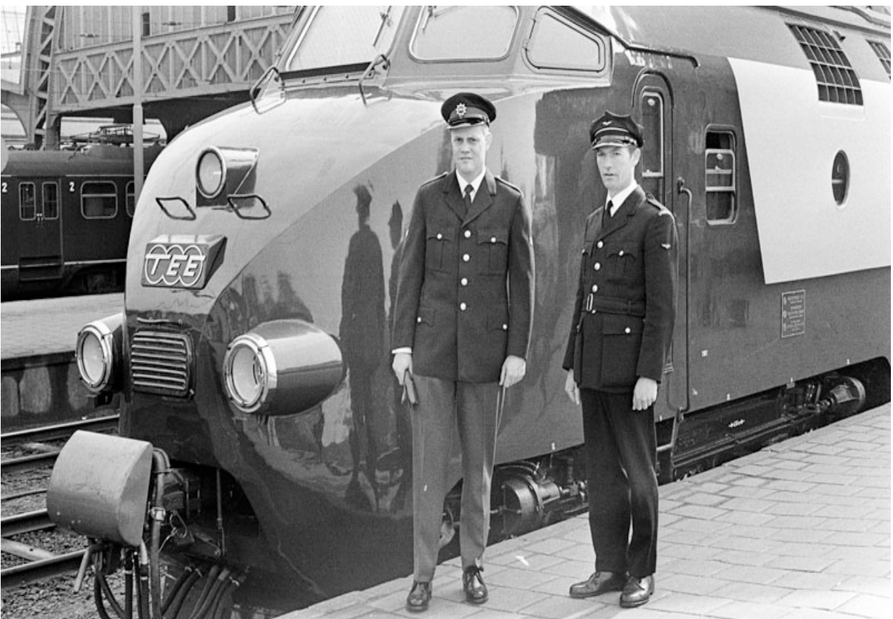
Foto: NS personeel spoorwegpolitie bij TEE

De presentatie wordt gegeven in een PowerPoint omgeving.