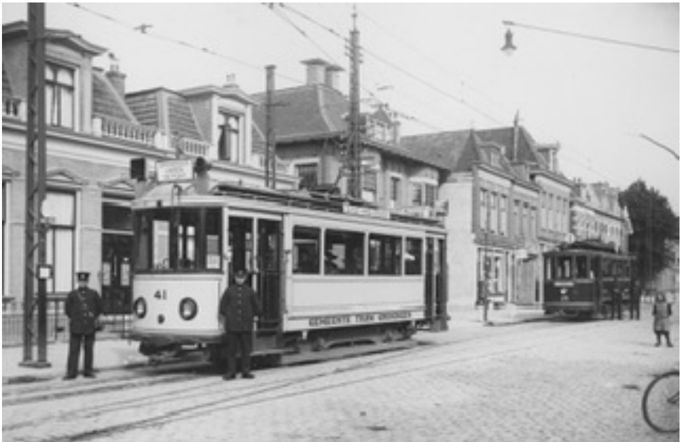
Foto: Groningen, Verlengde Hereweg, GTG 41 & 35, 1922. Beeldbank Groningen