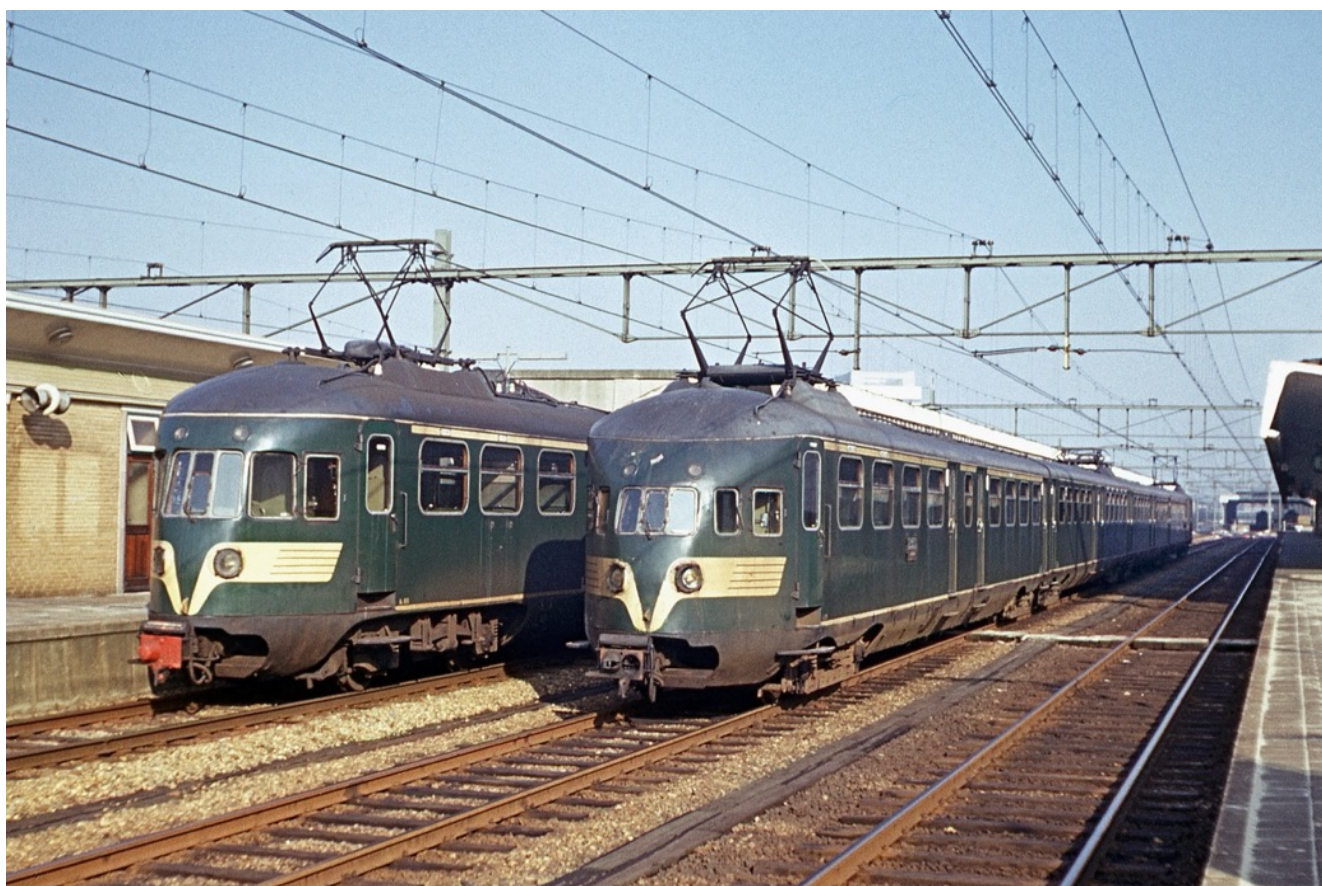
Foto: NS ELD 815 , NS ELD 608 in Rotterdam, 4 maart 1969

Het verhaal laat zien hoe ik dankzij NS-personeel en een aantal mede spoorwegliefhebbers de veranderingen in het reizigersmaterieel volgde. En inderdaad: ik was 14!