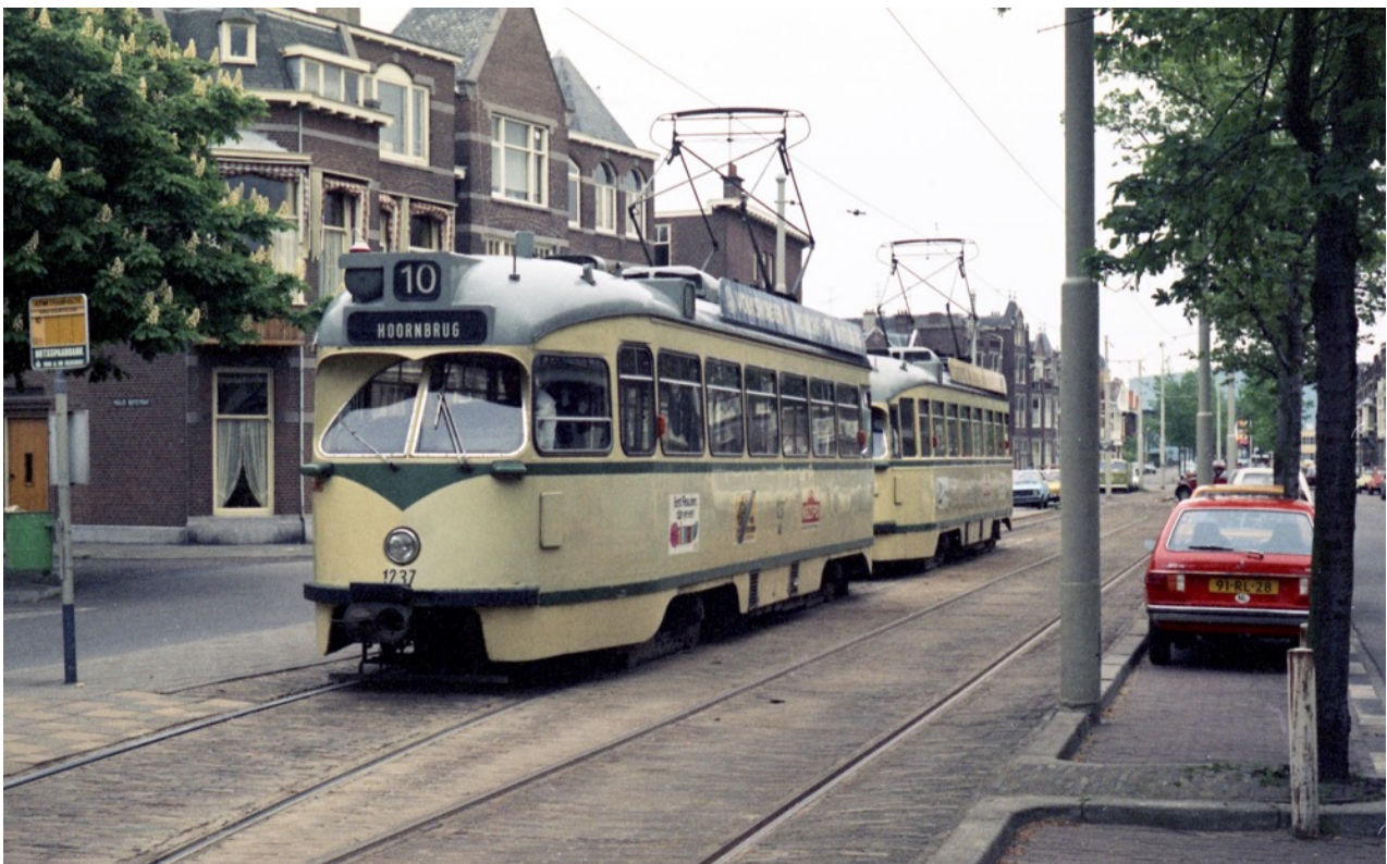
Den Haag 1981.

19:30 uur, stationsrestauratie SHM Hoorn