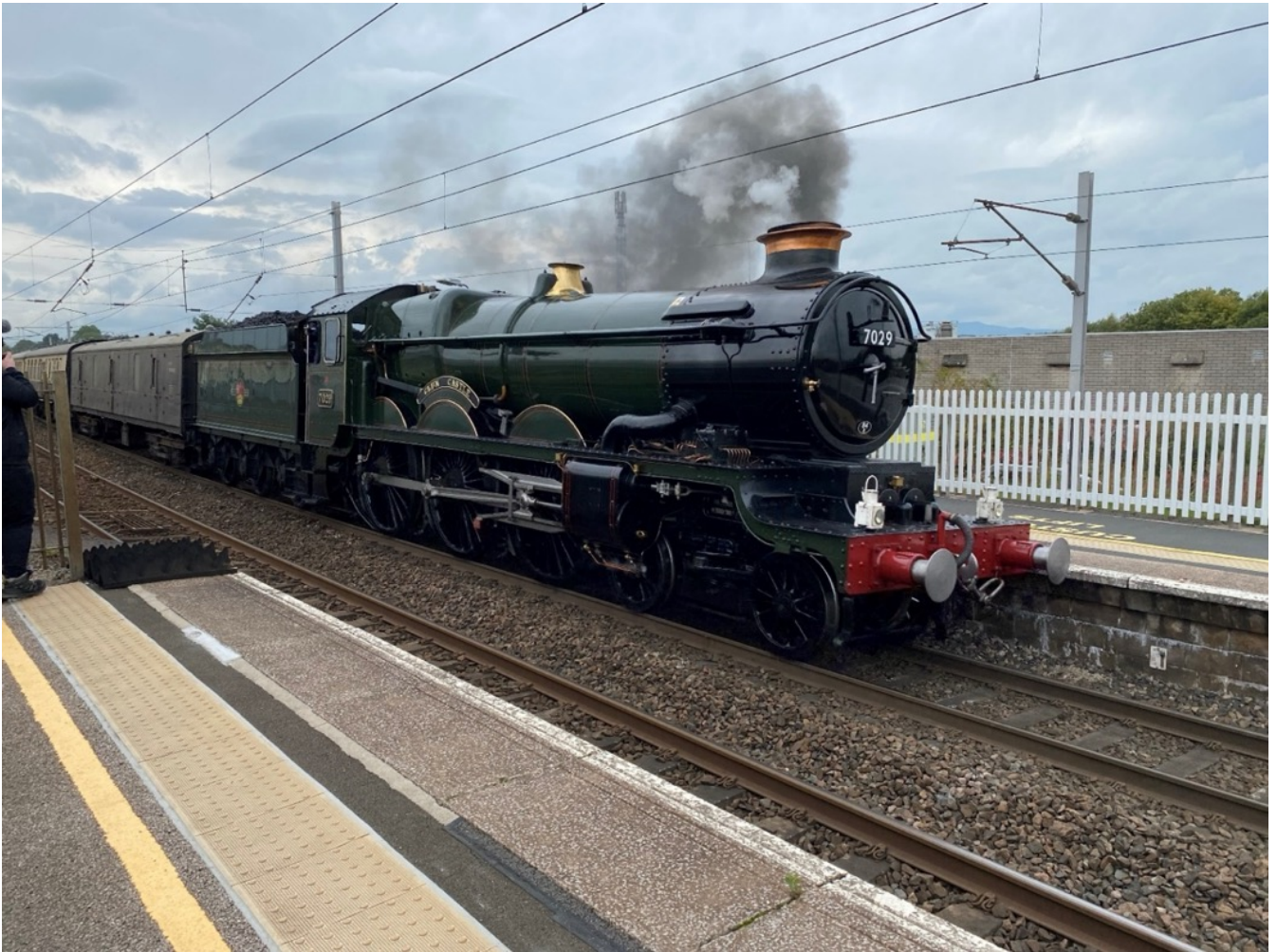
7029 Clun Castle - Great Western Railway.

Hoe kijkt hij aan tegen stoomlocomotieven op het spoor? Toen, nu en in de toekomst? Een blik op een aansprekend fenomeen door de ogen van een liefhebber en tegelijkertijd beleidsmaker.