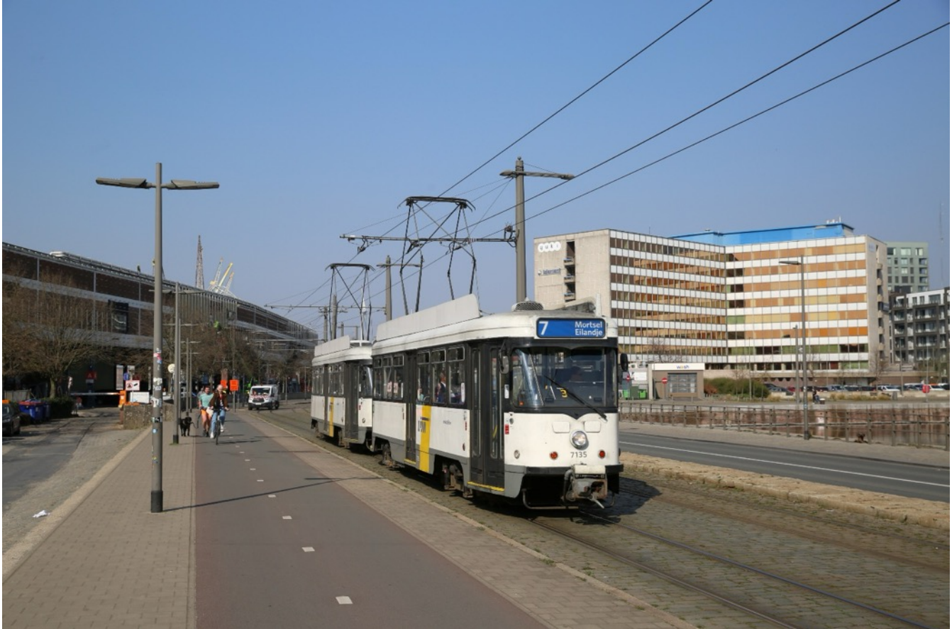
Antwerpen, 2022.

Met enige vertraging door de Tweede Wereldoorlog is de PCC-car ook in Europa een succes geworden, vooral door de activiteiten van het Belgische consortium Electroraail dat de licentierechten van de Amerikaanse ontwerpers had verworven. Achtereenvolgens Den Haag, Brussel, Antwerpen en Gent kozen voor de PCC, later gevolgd door de Franse steden St. Etienne en Marseille. Alleen bij de Belgische Buurtspoorwegen werd dit materieeltype geen succes.