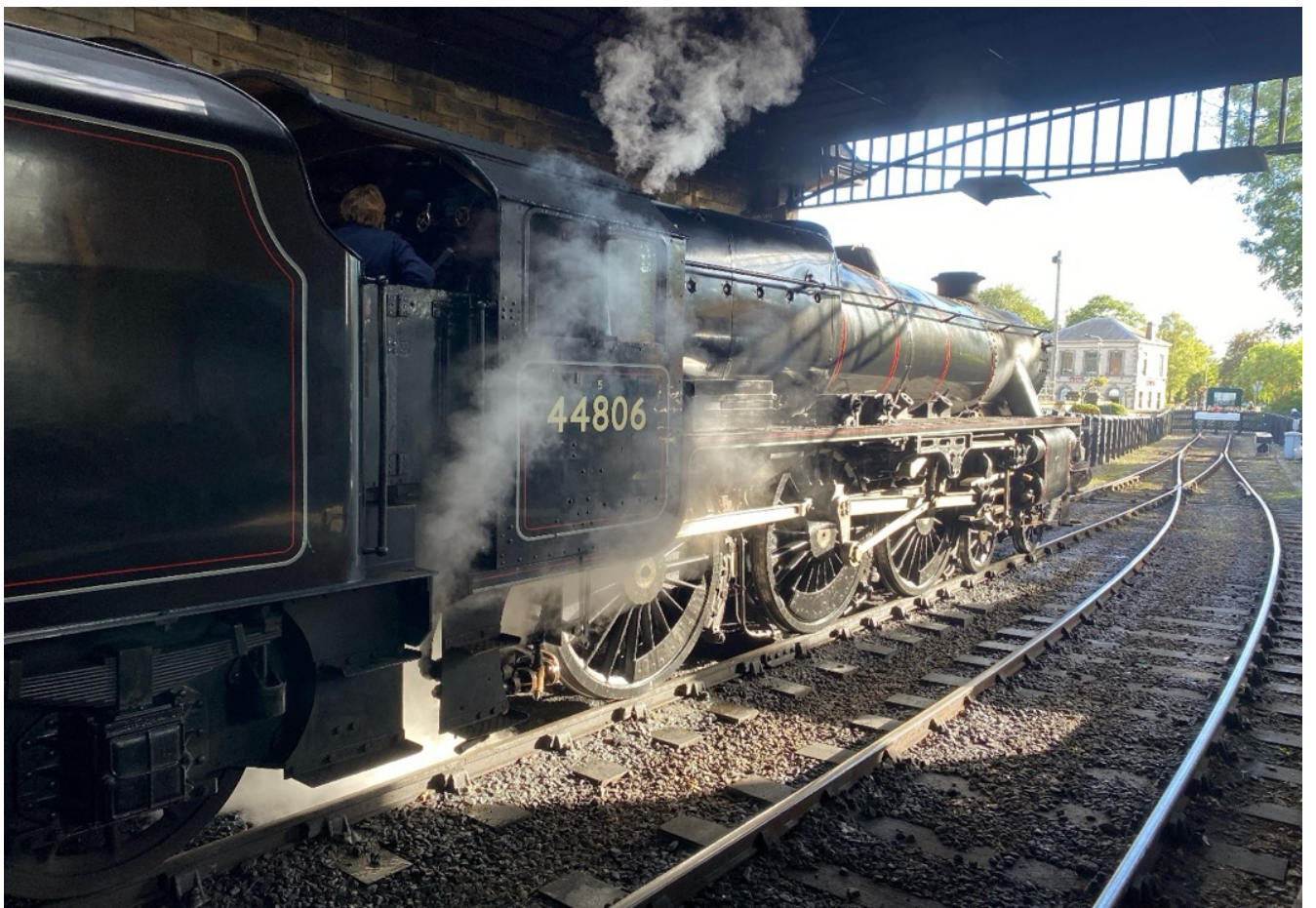
2025, NYMR 44806 na binnenkomst in Pickering.