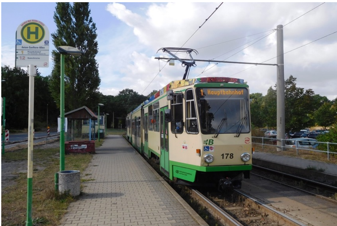
Brandenburg ad. Havel: Tw 178 eindpunt lijn 1 30-9-2016.

Ik begin met een korte PowerPointpresentatie met achtergrondinformatie. De films geven een mooi overzicht van de bezoeken die ik tussen 2009 en 2016 aan Brandenburg bracht.