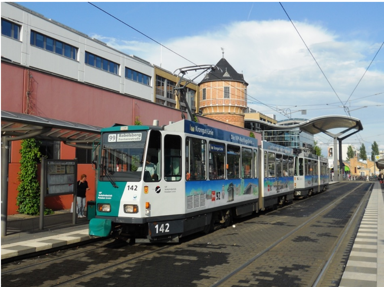
Potsdam Hbf. 5 augustus 2011.

Rondom Berlijn strekt zich Brandenburg uit. Het is na Mecklenburg-Vorpommern de minst dichtbevolkte deelstaat. Potsdam, de hoofdstad, is met 183.000 inwoners de grootste stad. Potsdam ligt aan de S-Bahn en heeft een trambedrijf. Het wereldberoemde Sans Souci is de belangrijkste toeristische trekpleister.