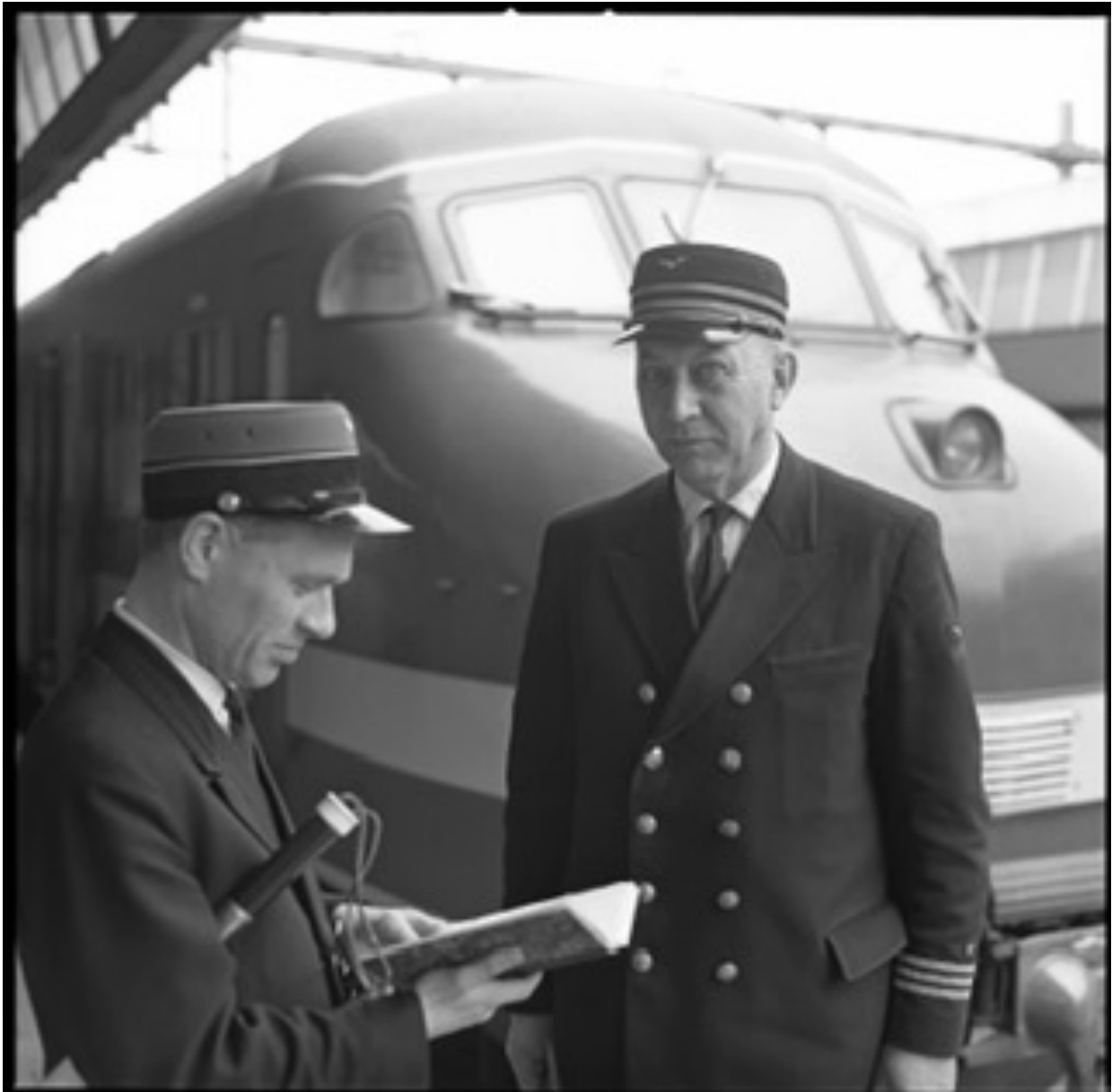
Foto: NS personeel jubilaris 40 jaar trouwe dienst met chef station Rotterdam CS 1965-4

Een presentatie over de rang en stand en wat voor uniformen er werden gedragen bij het spoorwegpersoneel.