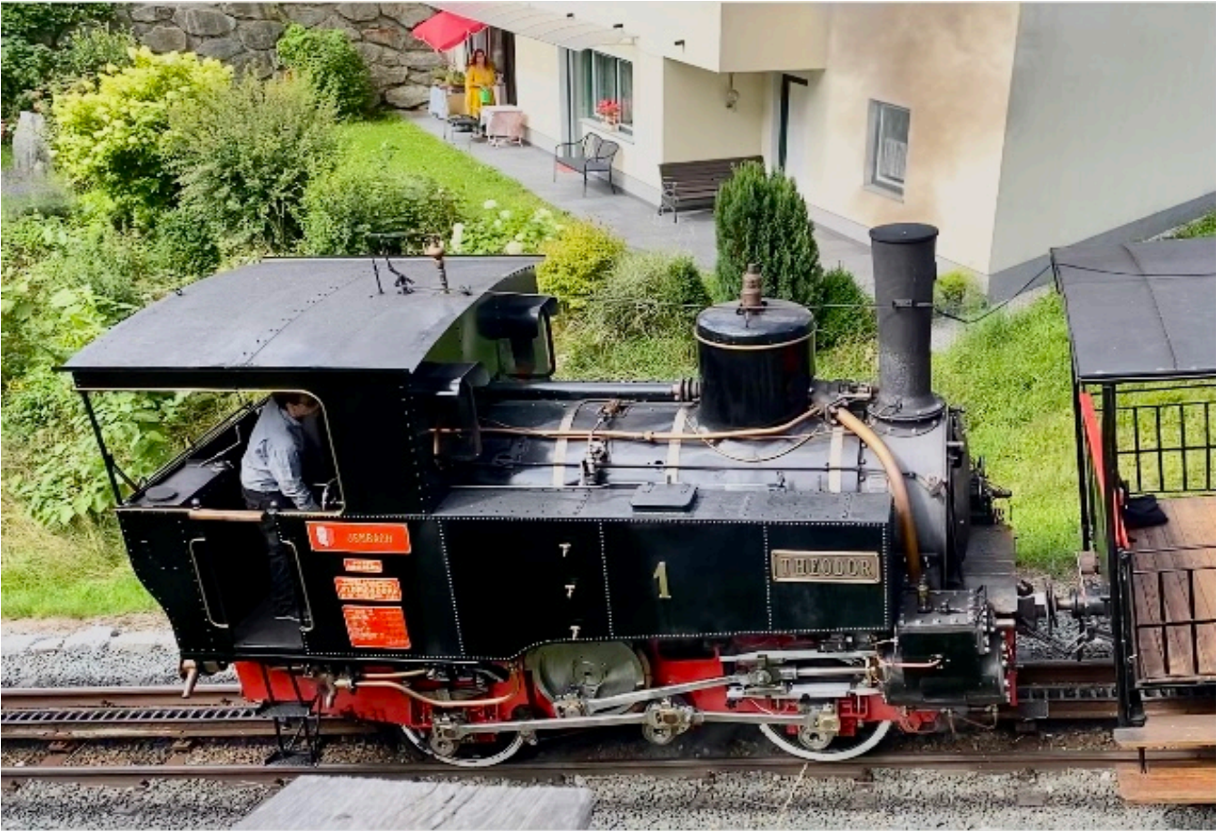
Achenseebahn, Eben, Oostenrijk, juli 2025.