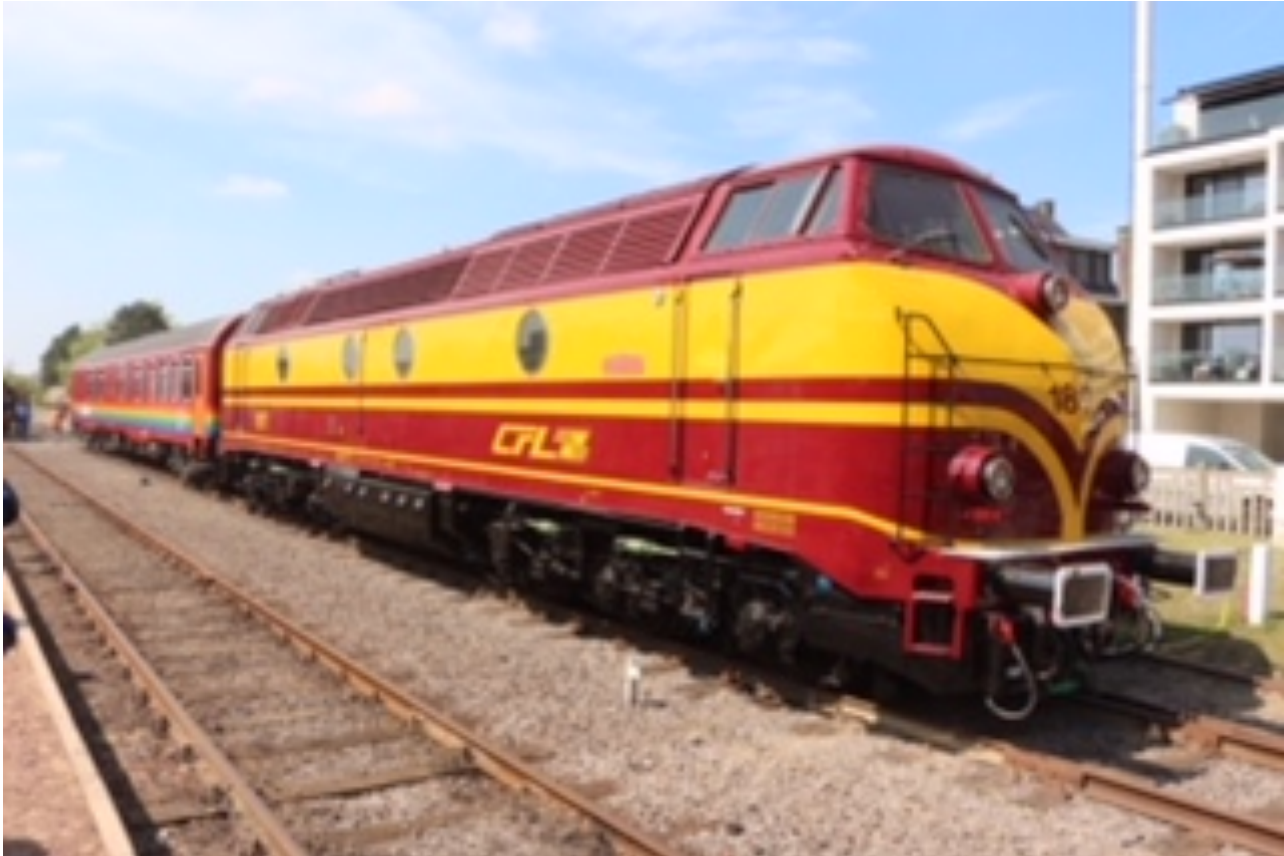
Foto: Een andere beeldbepalende CFL locomotief was de serie 1800. Deze zijn al enkele jaren buiten dienst in Luxemburg. Daar is de 1806 als museumloc bewaard gebleven

Inmiddels wordt het huidige beeld bepaald door fraai en modern dubbeldeksmaterieel, maar u ziet ook nog genoeg beelden van inmiddels vervlogen tijden met vele diesellocs en internationaal materieel, zelfs van de NS.