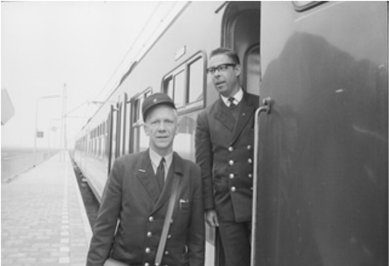
Foto: NS personeel mcn en hc 1969

De presentatie wordt gegeven in een PowerPoint omgeving.