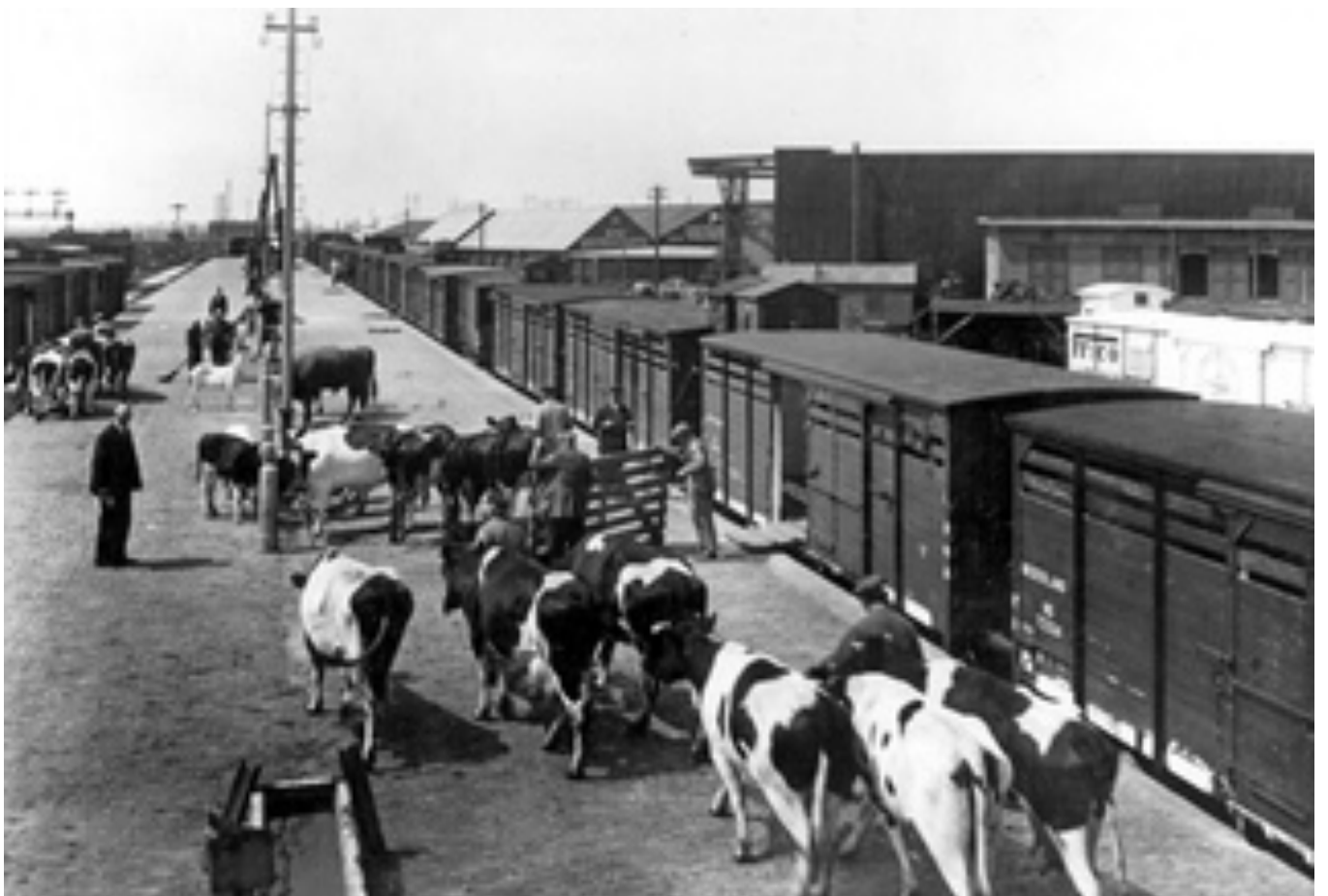
Foto: Leeuwarden NS 7233, 4 en andere veewagens met vee, 1935.