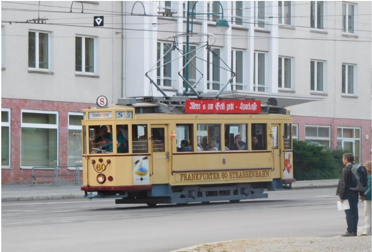
Frankfurt Oder. TW60 1938. 24-9-2016.

De Buckower Kleinbahn vinden we halverwege Berlijn en Frankfurt (Oder). Van deze elektrische museumlijn is een reportage te zien. De elektrische installatie is identiek aan die van de Berlijnse S-Bahn.