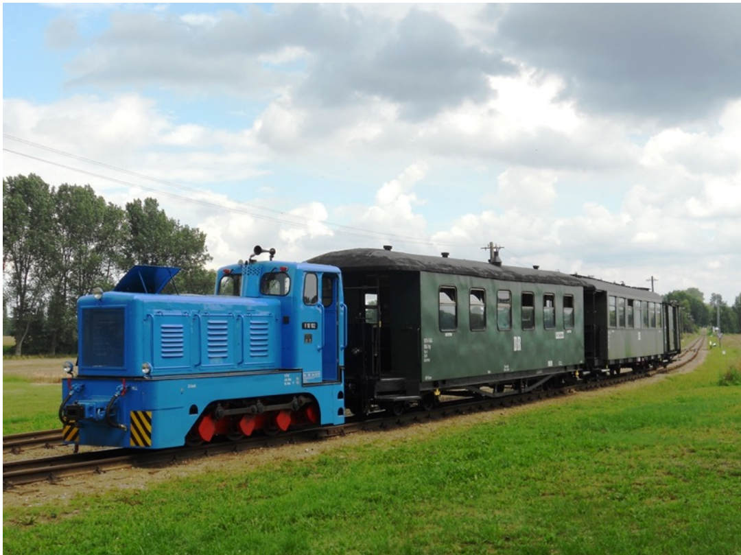
Prignitzer Kleinbahn. 6 augustus 2011.

Tenslotte gaan we naar het noordwesten voor een bezoek aan de Prignitzer Kleinbahn "Pollo". Op een stukje van het ooit uitgestrekte net rijdt de museum trein getrokken door een V10C.