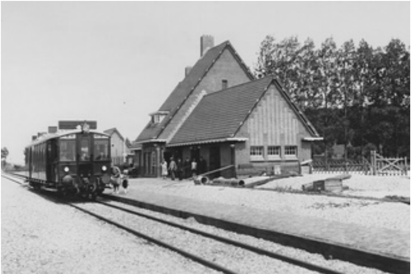
Foto: Slochteren, NS omBC 1907 (1929, Werkspoor), stationsgebouw, Woldjerspoorweg Groningen - Weiwerd

In deze reis door het verleden, met aandacht voor diverse aspecten van het railvervoer en de omgeving daarvan, zijn de verhalen zeker zo belangrijk als de beelden.