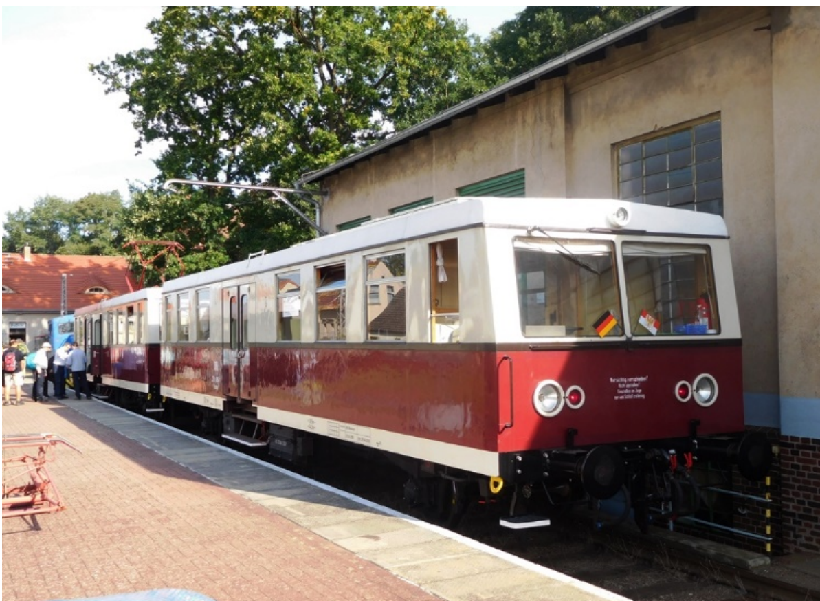
Buckower Kleinbahn 25 september 2016.

De Buckower Kleinbahn vinden we halverwege Berlijn en Frankfurt (Oder). Van deze elektrische museumlijn is een reportage te zien. De elektrische installatie is identiek aan die van de Berlijnse S-Bahn.